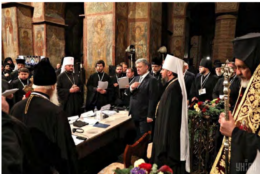
Unification Council, St. Sophia Cathedral, Kyiv, Ukraine. December 15, 2018.

Your Beatitude, Most Reverend Metropolitan, Beloved in Christ, Vladyka Epifaniy!