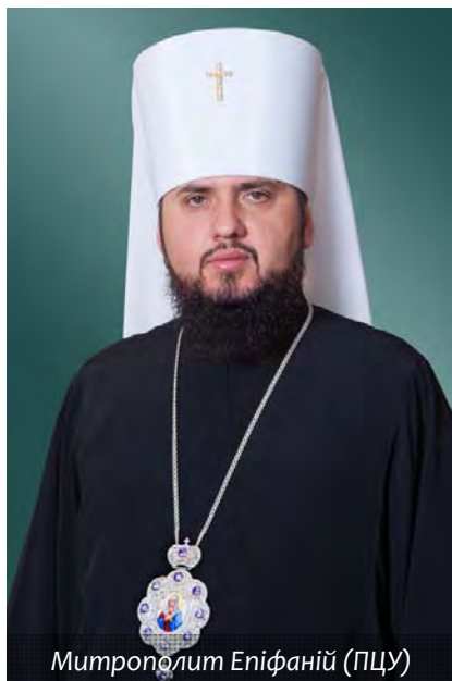
Митрополит Епіфаній (ПЦУ)

Ваше Блаженство, Блаженніший Митрополите, Возлюблений у Христі Владико Епіфаніє!