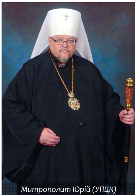
Митрополит Юрій (УПЦК)